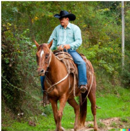
Un cavallo a cavallo di un cowboy