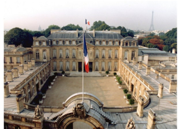
Le Palais de l'Élysée à Paris