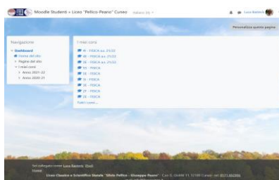
Figura 1 – Schermata piattaforma Moodle corsi curricolari

La piattaforma per i corsi curricolari è stata strutturata associando un corso per ciascuna classe e materia insegnata. In questo modo ciascun docente può visionare un numero di corsi pari alle materie e classi insegnate, così come gli studenti possono visionare un corso per ciascuna delle materie frequentate. Per tutti è prevista la possibilità di visionare lo "storico", ovvero i corsi degli anni precedenti.