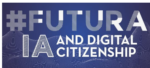
Figura 4 – Logo progetto #FUTURA IA AND DIGITAL CITIZENSHIP

all'interno dei curricoli della scuola italiana di ogni ordine e grado, avendo consapevolezza che non è sufficiente un approccio a questi temi sotto il profilo semplicemente "tecnologico", ma che è fondamentale promuovere una riflessione critica da parte della scuola sugli aspetti sociali, etici e relazionali che questi temi solleveranno nel futuro a breve, medio e lungo termine. In questo senso il percorso si inserisce a pieno titolo nell'ambito dell'educazione civica e vuole esserne anche un'interpretazione innovativa, connotata da una forte componente interdisciplinare. Il materiale realizzato è stato per questo motivo raccolto su di un corso Moodle, in quanto compatibile con formati comunicativi differenti (video, link, dispense, pdf ecc..). Inoltre la piattaforma permetterà anche ai docenti di confrontarsi ed esprimere un parere sull'utilizzo del materiale.