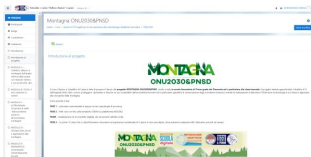
Figura 2 – Corso Montagna ONU2030&PNSD

Il corso Montagna ONU2030&PNSD, invece, è la piattaforma di riferimento per il relativo progetto [6] rivolto a tutte le scuole secondarie di primo grado del Piemonte ed in particolare alle classi seconde. Il progetto intende approfondire il goal 15 dell'Agenda ONU 2030, ovvero proteggere, ripristinare e favorire un uso sostenibile dell'ecosistema terrestre ed in particolare garantire la conservazione degli ecosistemi montuosi, tramite la realizzazione di laboratori STEM dove la tecnologia e la scienza si applicano alla riscoperta della montagna.